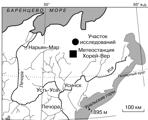
Рис. 1. Географическое положение участка исследований.

Полевые работы проводились в Ненецком автономном округе на территории Северо-Хоседаюсского нефтяного месторождения (3 км к юго-западу от центрального пункта сбора нефти месторождения). Участок исследований расположен на границе южной и типичной тундры, в 55 км к северо-востоку от метеостанции Хорей-Вер (рис. 1). Участок находится в пределах урочища Изъямыльк в заболоченной долине р. Изъямылькшор (левый приток р. Колва). Территория характеризуется чередованием дренированных увалистых массивов с плоскими заболоченными слабодренированными участками. Среднегодовая температура, по данным метеостанции, в 2014 г. составила -4.5^{\circ}\text{C} . Многолетняя среднегодовая норма осадков 500 мм, из них 350 мм выпадает в теплый период. Средняя многолетняя мощность снежного покрова 45 см [Атлас..., 1976]. На участке исследований зимняя дорога пересекает тундровые при-