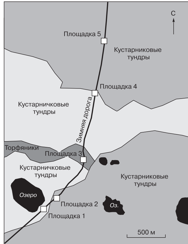
Рис. 2. Карта-схема участка исследований.

Зимняя дорога была введена в эксплуатацию в 2007 г. и активно использовалась до 2010 г. в период строительства объектов инфраструктуры нефтяного месторождения. В последующие годы дорога периодически эксплуатировалась в зимнее время для транспортировки грузов и техники на территорию месторождения. Колеи зимней дороги характеризуются корытообразной формой, глубина 5–15 см, ширина 60–100 см. В результате прокладки дороги возникли нарушенные условия произрастания растительности (табл. 1).